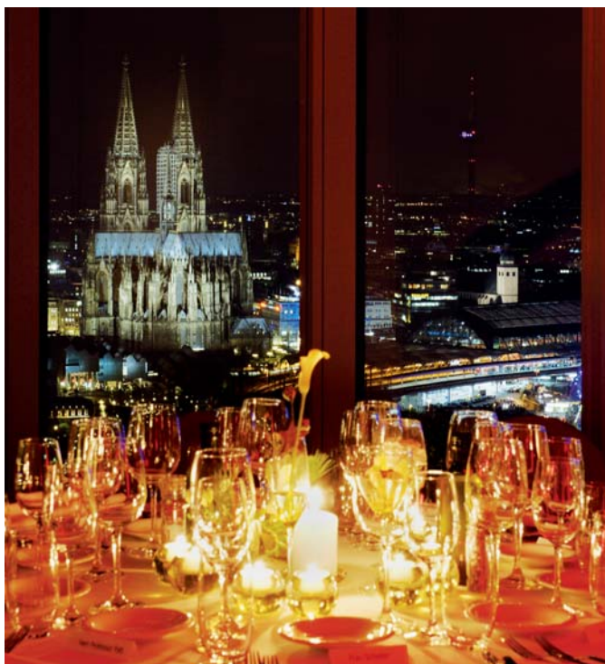
Einmalig: die Aussicht von KölnSKY auf das nächtliche Köln.

Übrigens: Im KölnSKY kann auch geheiratet werden. Der Standesbeamte erwartet die Paare auf der 27. Etage vor der faszinierenden Kulisse des Kölner Doms. Und nach der Trauung findet dann nur ein paar Schritte weiter ein stilvoller Empfang beziehungsweise ein wunderschönes Fest statt.