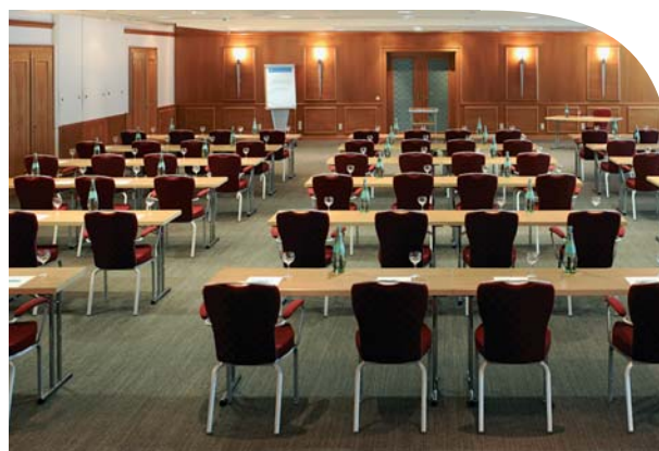
Tagungspauschale ab EUR 45,00 pro Person

Unser Business-Team steht Ihnen für individuelle Planung und Durchführung Ihres Events mit Rat und Tat zur Seite.