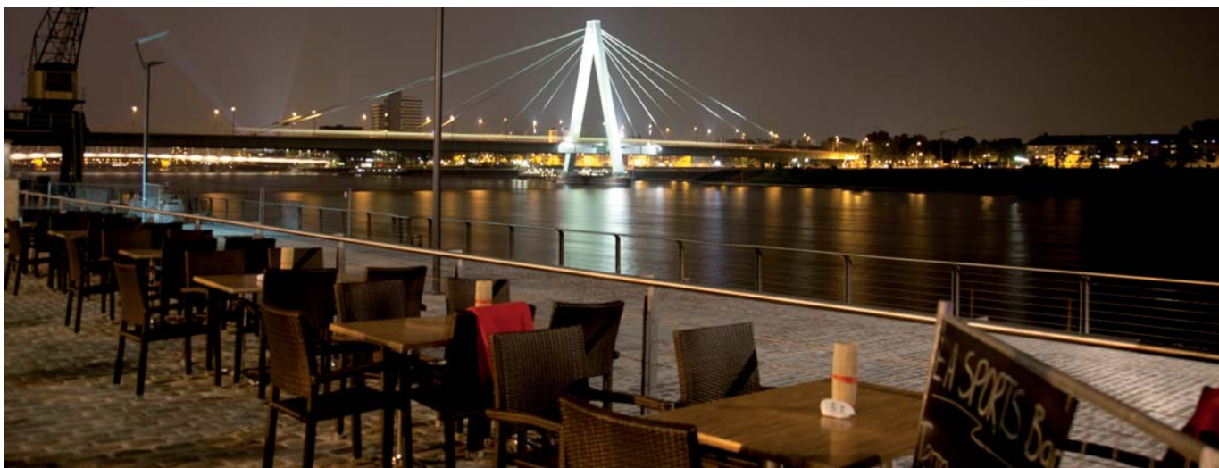
Ein Sommerabend auf der Terrasse der EA SPORTS Bar.