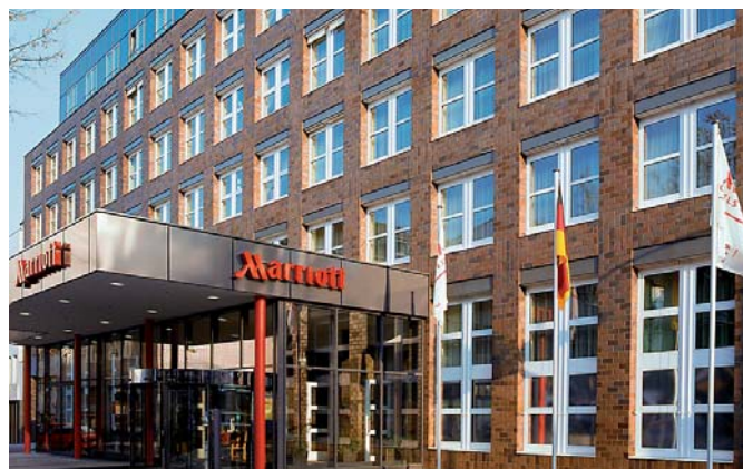
Das Marriott ist das Lieblingshotel von Geschäftsreisenden.