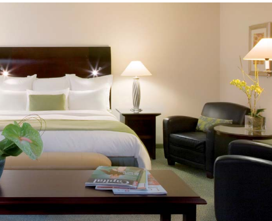
Die Zimmer im Renaissance: edel und behaglich.

andere private Anlässe nutzen.“ Davon haben schon viele Kölner profitiert.