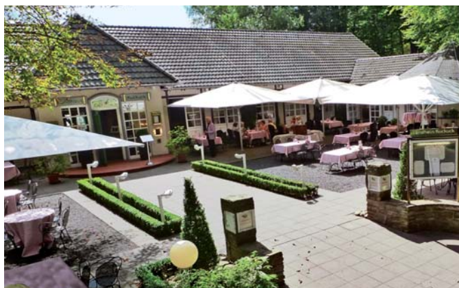
Die wunderschöne Terrasse des Kuckuck lädt zur Einkehr ein.